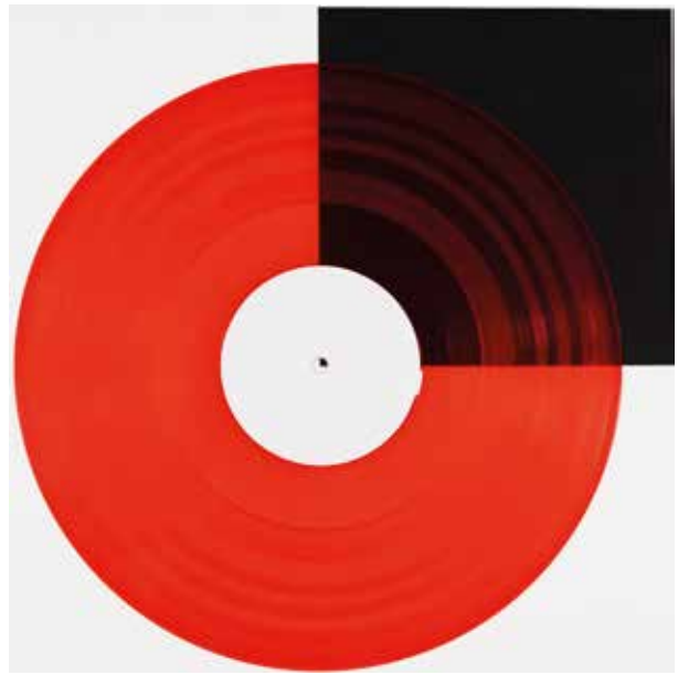
Rot transparent | red transparent