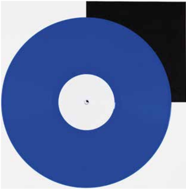
Blau | blue