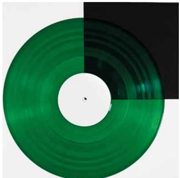
Grün transparent | green transparent