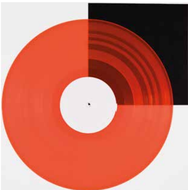
Orange transluzent | orange translucent