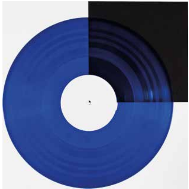
Blau transparent | blue transparent