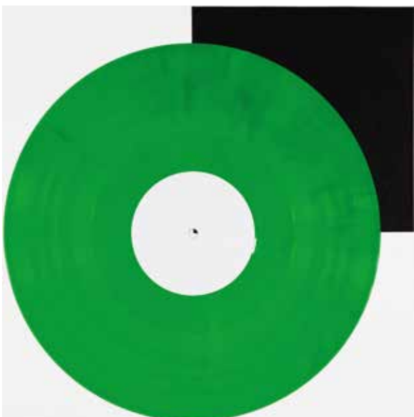
Hellgrün | light green