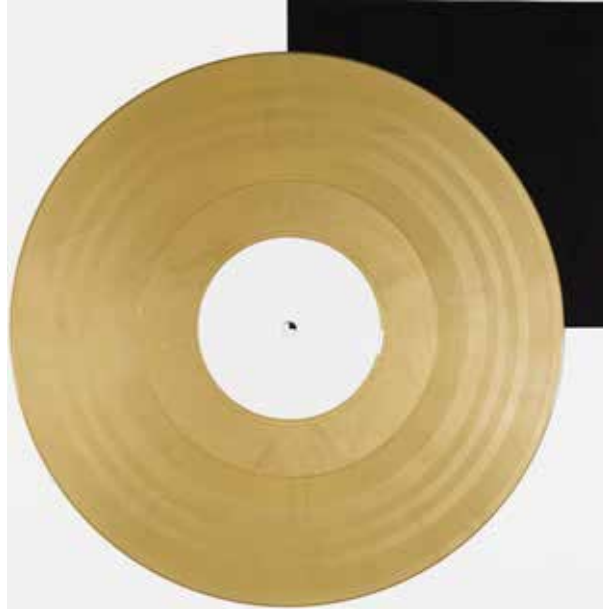
Gold | gold

Das Material für die Herstellung von farbigen Schallplatten unterscheidet sich von schwarzem Vinyl. Unterschiedliche Bestandteile und verschiedene Mischungen können die Klangqualität beeinflussen. Unter anderem kann dies zu einem höheren Grundrauschen, zu Nebengeräuschen im Einlauf sowie Auslauf und in leiseren Passagen führen.