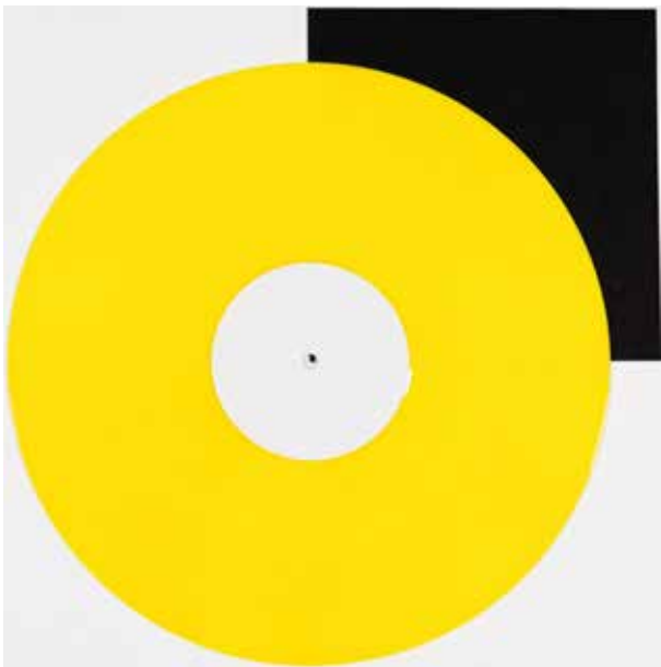
Gelb | yellow