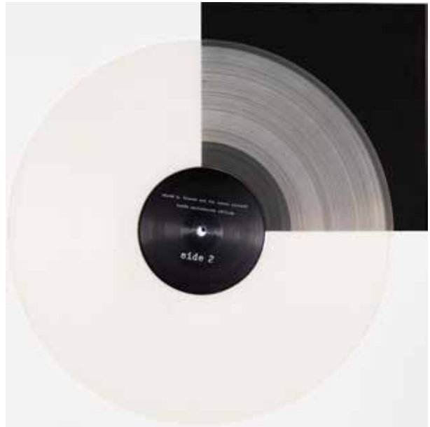
Naturell | natural