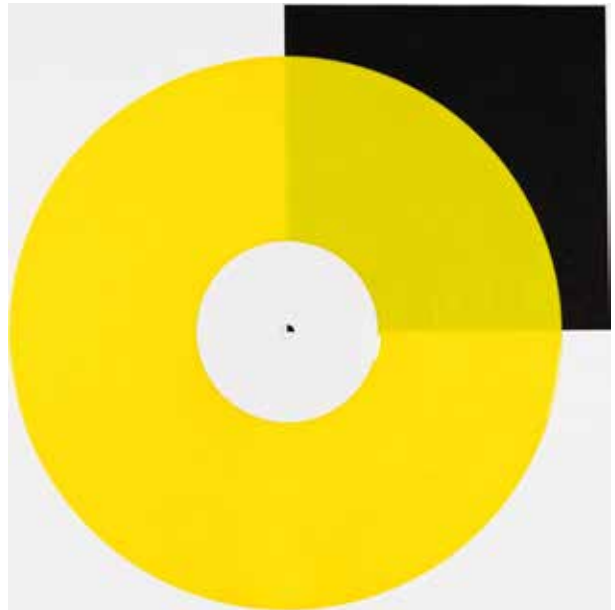
Gelb transparent | yellow transparent