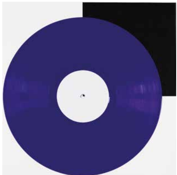
Violett | purple