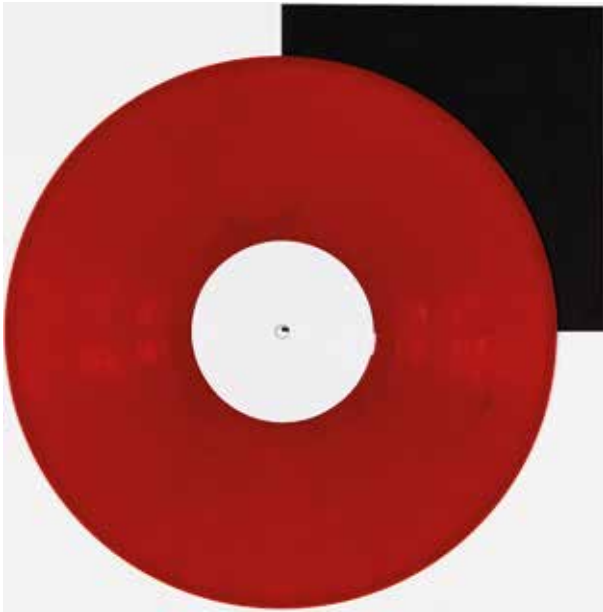
Rot | red